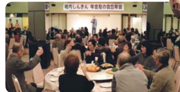
稚内支部会員の皆さま 「忘年会」