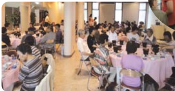
稚内支部会員の皆さま 「びふか温泉日帰り旅行」