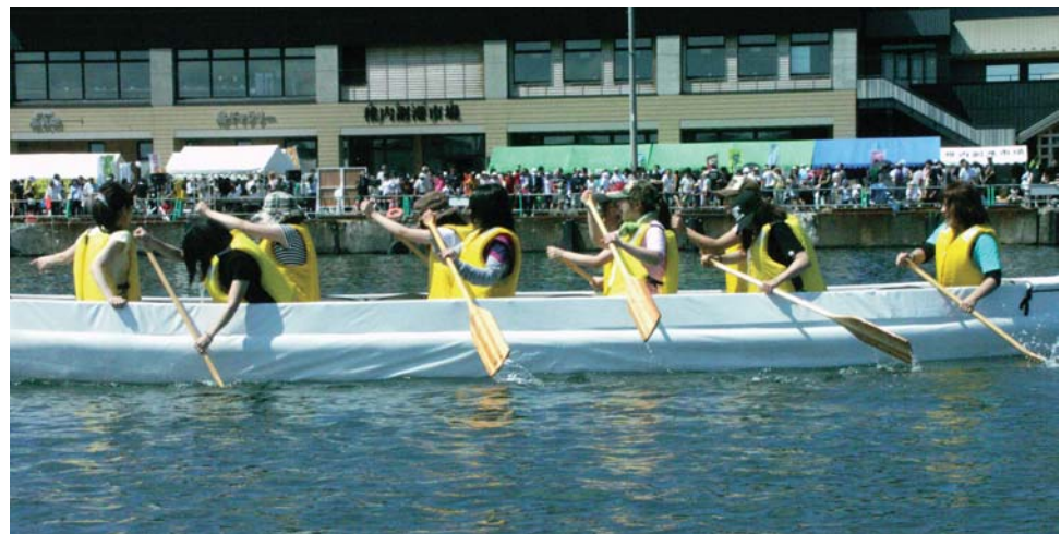
1チーム10名編成。先頭(船頭)の音頭取り1人、こぎ手8人、かじ取り1人の計10人。16歳以上であれば誰でも参加OK

「最北の夏を彩る」稚内みなと南極まつり」は、楽しんで盛り沢山！ 副港ボートレースは「稚内みなと南極まつり」の一環として行われていきますので、その他の各種行事もお伝えしておきましょう。厳かに「南極樺太犬慰霊祭」からはじまるこのおまつりは、その後一気に賑やかになって、明るい時間帯は小さな子どもからお年寄りまで、楽しみが盛り沢山。夜の部は恒例の「北海道っぺんおどり」「南極おどり」で、中央アーケード街を中心に盛大な踊りを繰り広げます。また、稚内駅前広場には「花火大会ビアガーデン」が設けられ、北防波堤ドーム公園を会場に大花火大会(2,500発)でフィナーレを迎えます。なお両日とも中央町の特設会場ではビアガーデン・飲食特産品コーナーを設置し「わっかない観光物産まつり」が開催され、交流の深い最南端の沖繩石垣島、鹿児島県枕崎市、また復興支援として福島県会津若松市の特産品フェアを多くの市民が足を運び、北国の短い夏を謳歌しました。