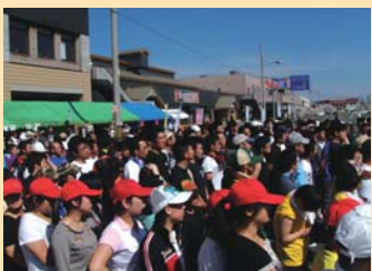
多数の観客で埋め尽くされる会場

賞金総額35万円獲得を目指して白熱したレースが展開されました。会場には複数の屋台が仮設され、焼鳥や焼きそば、ラーメン、あるいはカキ氷、生ビールを片手にレースを楽しむ姿が多数見られ、参加者も来場者も関係者も主催者も大いに盛り上がりを見せたところでした。 さらにマリンジェットフリースタイルデモンストレーション、稚内建設青年会による協賛事業「土曜の日」では、大型の建設機械・重機などが展示紹介され、男子の子たちの目を釘づけにしていました。毎年仮装で参加する楽しいチームあり、本気で勝ちにくるチームありますが、80メートルのブイを時計回りで折り返す計160メートルを1分台で競い合う上位チームの差は、回を重ねるごとに僅差となり、今年は見事「中央小&稚中ティチャー&おやじい」(中央小&稚内中の先生・父兄で構成)が栄えある優勝に輝き、賞金15万円を手に入れました。また女子チームが5団体参加し、華を添えてくれた大会でもありました。