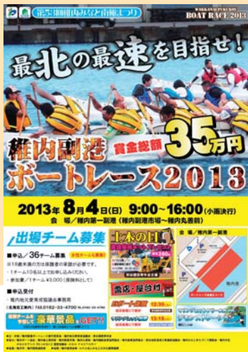
今年のチラシより

賞金総額35万円獲得を目指して白熱したレースが展開されました。会場には複数の屋台が仮設され、焼鳥や焼きそば、ラーメン、あるいはカキ氷、生ビールを片手にレースを楽しむ姿が多数見られ、参加者も来場者も関係者も主催者も大いに盛り上がりを見せたところでした。 さらにマリンジェットフリースタイルデモンストレーション、稚内建設青年会による協賛事業「土曜の日」では、大型の建設機械・重機などが展示紹介され、男子の子たちの目を釘づけにしていました。毎年仮装で参加する楽しいチームあり、本気で勝ちにくるチームありますが、80メートルのブイを時計回りで折り返す計160メートルを1分台で競い合う上位チームの差は、回を重ねるごとに僅差となり、今年は見事「中央小&稚中ティチャー&おやじい」(中央小&稚内中の先生・父兄で構成)が栄えある優勝に輝き、賞金15万円を手に入れました。また女子チームが5団体参加し、華を添えてくれた大会でもありました。