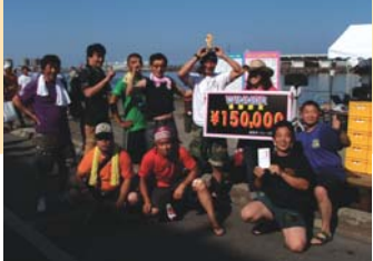
毎年、優勝チームは賞金を何に使うの？

賞金総額35万円獲得を目指して白熱したレースが展開されました。会場には複数の屋台が仮設され、焼鳥や焼きそば、ラーメン、あるいはカキ氷、生ビールを片手にレースを楽しむ姿が多数見られ、参加者も来場者も関係者も主催者も大いに盛り上がりを見せたところでした。 さらにマリンジェットフリースタイルデモンストレーション、稚内建設青年会による協賛事業「土曜の日」では、大型の建設機械・重機などが展示紹介され、男子の子たちの目を釘づけにしていました。毎年仮装で参加する楽しいチームあり、本気で勝ちにくるチームありますが、80メートルのブイを時計回りで折り返す計160メートルを1分台で競い合う上位チームの差は、回を重ねるごとに僅差となり、今年は見事「中央小&稚中ティチャー&おやじい」(中央小&稚内中の先生・父兄で構成)が栄えある優勝に輝き、賞金15万円を手に入れました。また女子チームが5団体参加し、華を添えてくれた大会でもありました。