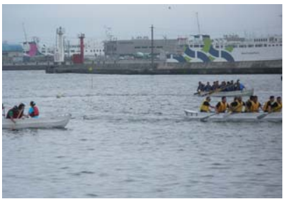
10名の呼吸を合せなければ1分台のタイムは難しい