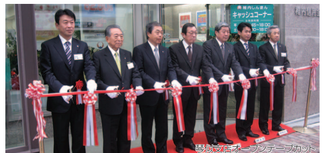
琴似支店オープンテープカット 稚内しんきん 琴似支店 札幌市西区山の手3条1丁目3番5号